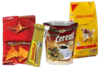
Envolturas de alimentos, bolsas de comida para mascotas.