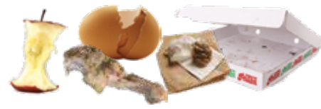
Desechos de alimentos y papel manchado con comida.