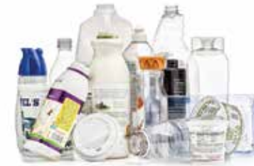
Botellas, frascos, jarras, cubetas y otros recipientes de plástico.