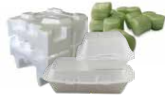
Espuma de poliestireno.