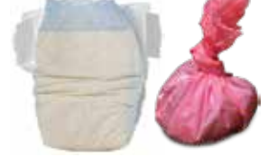
Pañales y desechos de mascotas.