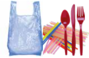
Bolsas, popotes y utensilios de plástico.

¿No sabe si un objeto es reciclable? Si tiene dudas, no lo arroje al bote de reciclables.