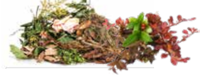
Desechos de jardín.