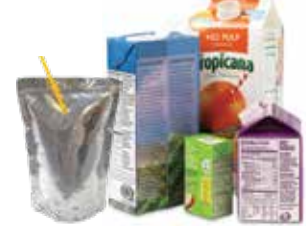
Bolsas/cajas de jugos, cajas de cartón (con tapas plásticas).

No arroje desechos domésticos peligrosos o desechos electrónicos al bote de basura. Para una manipulación correcta, vea el panel de desechos domésticos peligrosos.