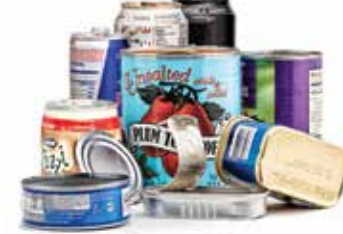
Latas para comidas y bebidas hechas de latón, aluminio y acero.